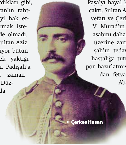
» Çerkes Hasan

Bir kimsenin halife sayılması için hem meşru bir yolla başa gelmesi, hem de halifelik yapabilecek güce sahip olması gerekir. Başta meşru bir »