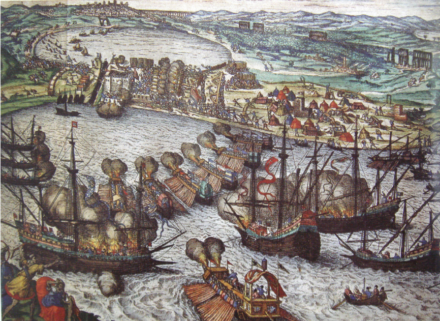
Tunus 1535'te İspanyollar tarafından işgale uğramış, Kıbrıs'ın fethini müteakip yeniden Osmanlı toprağı olmuştu. Halkü'l-Vad'a yapılan saldırıyı gösteren Jan Cornelisz Vermeyen'e ait bir tablo.

Müstakil beylerden zapt edilen yerlerde sadakatleri görülen bey hanedanlarına verilen yurtluk-ocaklığın tımandan farkı, mutlaka bir hizmet karşılığı olmaması, tevcihin geri alınmaması, sahibinin idarî ve bazı şartlarla bir dereceye kadar adli salahiyetleri haiz bulunmasıdır. Sağman, Kulp, Itak, Tercil, Mihrani, Pertek, Çapakçur, Çermik beylikleri gibi. Hükümetlerde ise tımar ve zeamet yoktur. Bunlar bey ve ailesinin mülkü