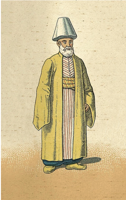
Osmanlı'da şehirlerin güvenliğini sağlayan subaşının tasviri.

Her eyaletin varidatı öncelikle kendisine harcanıp, artanı merkeze gönderilir. Artmazsa bununla iktifa edilerek merkezden takviye bahis mevzuu olmaz. Bu sebeple geliri yüksek eyaletler daha mamurdur. Rumeli'nin, Anadolu'ya göre daha mamur olmasının sebebi de budur. Osmanlı Devleti'nde sancaklar aynı kalmakla beraber, eyaletlerin sayısı, yeri ve merkezi zamanın getirdiği zaruretler sebebiyle hiç aynı kalmamıştır. Bazı limanların inkişafı, yol güzergâhlarının