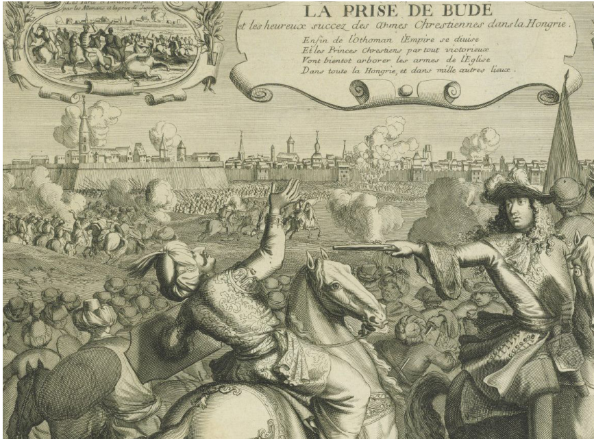
Budin Osmanlıların Avrupa içlerindeki en mühim eyaletlerindendi. 1636'da Budin'in düşüşünün bir tasviri. Anadolu Beylerbeyi tasviri (üstte).

18. asırda âyânlar, valilerden mütevellimlik ve voyvodalık elde ettiler [Mütesellim beylerbeyinin; voyvoda ise hanedan ve sadrazamın hâsalarını vekaleten idare eden kimsedir]. Boşalan ve yeniden verilmeyen tımarları iltizam yoluyla elde ederek güçlerine güç kattılar. Âyânların vefatından sonra da, ailesinden veya mensuplarından biri yerine geçirdi. Zamanla da buldukları yerde müstakil hareket etmeye, hükümetin nüfuzunu hiçe saymaya başladılar. Böylece âyânlar mütegalibeye dönüştü. Sultan II. Mahmud tahta çıkar çıkmaz, âyân ile bir sulh yapmaya mecbur kaldı. Bu fırsattan istifade ile âyânların nüfuzunu kırmaya ve merkezî idareyi tekrar tesise muvaffak oldu. Ölen âyânların yerine vârisinin geçmesine engel olarak, merkezden adam tayin etmiş; bazı âyânların üzerine ordu gönderip ele geçirilenleri sürgüne yollamış, güçlü âyânları da birbirine düşürerek safdışı etmiştir. Âyânlık yerine de 1833'den itibaren köy ve mahallelerde muhtarlıklar teşkil edilmiştir.