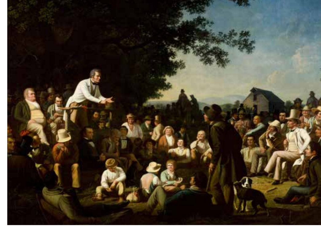
Aynı zamanda politikacı olan ABD'li ressam George Caleb Bingham "Stump Speaking" (1853-54) adlı tablosunda Missouri'lileri kendi lehine oy vermeye ikna etmeye çalışan bir politikacıyı tasvir etmiş. Sağ tarafta oturan silindirik şapkalı "üstün vatandaş" temsili değişime dirençli eski eğilimleri, soldaki konuşmacı ise daha esnek ve halka yakın duran günün politikacısını sembolize ediyor.