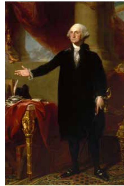
Gilbert Stuart'ın firçasından George Washington (1796).

Başkanlık sistemi, parlamenter sistemin aksine, kuvvetler ayrılığını sert biçimde tatbik eden ve icraya belli bir üstünlük tanıyan sistemdir. Başkanlık sisteminde, parlamenter sistemin aksine kuvvetler ayrılığı katıdır. Müesseseler arasında bir denge ve fren usulü kurulmuştur. Kongre (parlamento) başkanlık sisteminin birinci ayağıdır. Temsilciler meclisi ve senato olmak üzere iki kanatlıdır. Senatoda 50 eyaletin seçilmiş ikişer temsilcisi vardır. İki yılda bir üçte biri yenilenir. Temsilciler meclisininin 435 azası 2 yılda bir dar bölge sistemiyle nüfusa göre seçilir. Kanun yapmak, borçlanmak, vergi koymak, anlaşmaların tasdiki, harp ilanı ve bütçe hazırlamak kongreye aittir.