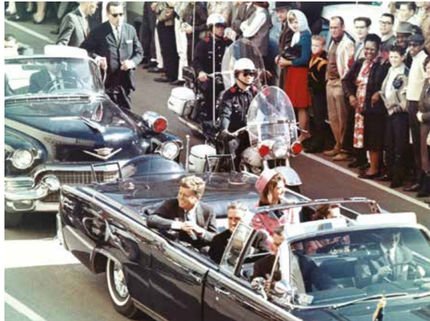
ABD'nin 35. başkanı John F. Kennedy 22 Kasım 1963 Cuma günü saat 12.30'da suikasta uğramadan önce başkanlık limuzininde.