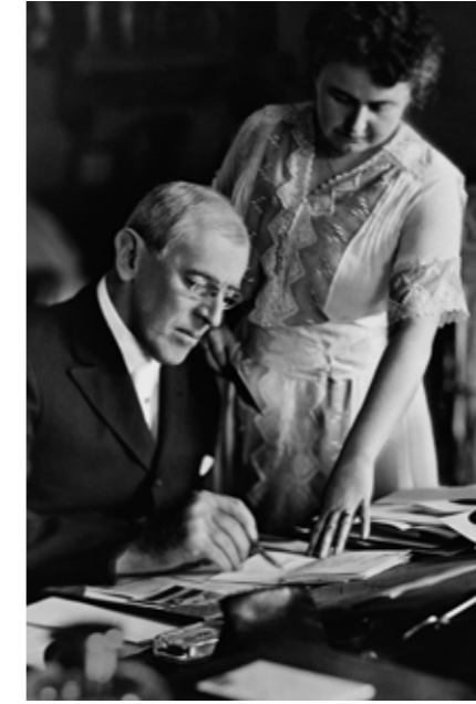
Woodrow Wilson, "gölge kadın başkan" lakaplı eşi Edith Bolling Galt ile.

Wilson, Birleşmiş Milletler'in nüvesini teşkil eden Milletler Cemiyeti'nin kurucusu kabul edilir. 1919 yılında Nobel barış mükâfatı aldı. Her millete kendi kendisini idare etmek hususunda söz hakkı tanıyan prensipler Wilson Prensipleri diye