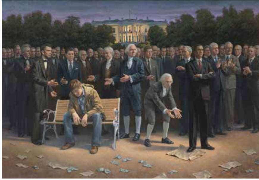
ABD'li Jon McNaughton'un tablosunda (2010) dönemin başkanı Barack Obama ile önceki 43 başkan Beyaz Saray önünde tasvir edilmiş. "Anayasanın Babası" James Madison, ABD anayasasını çığneyen Obama'ya müdahale etmeye çalışıyor. Banktaki genç adam bezgin, gelecekten umutsuz...

Başkan yılda 200.000 $ maaş alır. Seyahat için 100.000, eğlence için 12.000 ve diğer masraflar için de 50.000 $ ayrıca tahsisatı vardır. Başkan yardımcısı ise 94.000 $ maaş + 10.000 $ tahsisat alır. Emekli olunca başkanlara ölene kadar 70.000 $ maaş ile bir o kadar da büro masrafı verilir. Bedava bir de büro tahsis edilir. Posta hizmetleri emekli başkanlara ücretsizdir.