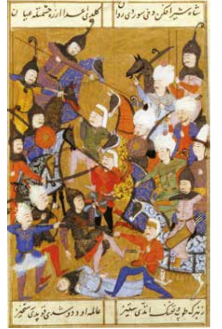
Çaldıran Savaşı'nın bir tasviri (Selimnâme 131b).

19 Mayıs'ta Kemah Safevilerden alındı. Sonra Maraş ve Elbistan'a inerek harekât