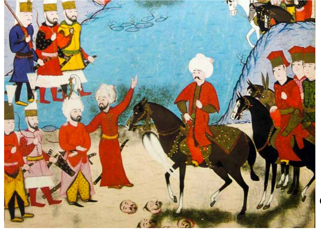
Yavuz Sultan Selim'in Çaldıran seferinden dönüşünü tasvir eden bir minyatür (Hünername).

1 Haziran'da Konya'ya varıldı ve Mevlevî-meşrep padişah, Mevlânâ türbesini ziyaret etti. Ordunun 40 bin