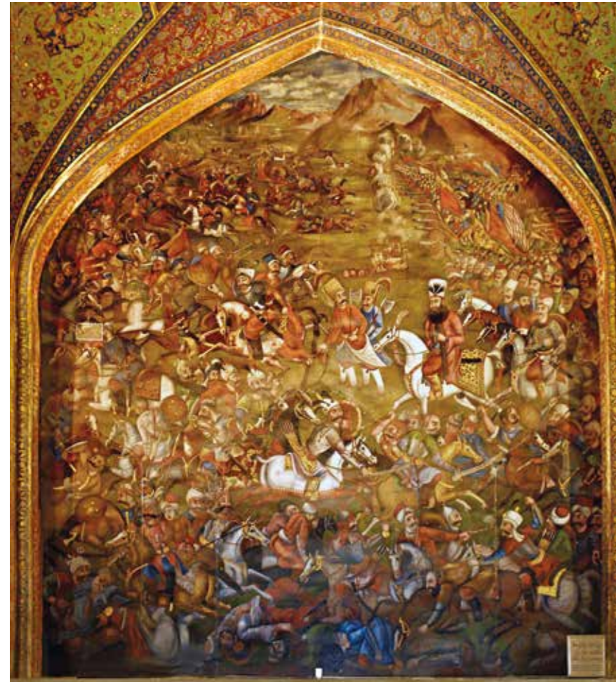
Yavuz Sultan Selim'in Mısır seferi sonrasında İstanbul'a Topkapı Sarayı'na getirdiği mübarek Sakal-ı Şerif (üstte). İran'ın İsfahan şehrindeki Çehel Sütun (Kırk Sütun) Sarayı'nın duvarlarından birinde bulunan Çaldıran Savaşı tasviri.

Çaldıran zaferinin neticesi olarak Tebriz-Halep ve Tebriz-Bursa ticaret yolu açıldı. Bu vesileyle başta Diyarbekr olmak üzere Harput, Meyyafarikin, Bitlis, Hınkeyfa, Urfa, Mardin, Cizre, Rakka ve Musul şehirleri muharebesiz olarak Osmanlı hâkimiyetine girdi. Molla Câmî'nin talebelerinden İdris Bitlisi, Tebriz'deki Akkoyunlu sarayında kâtip idi. Akkoyunlu Devleti'ni yıkan Safevilerin davetini reddedip Osmanlılara sığınmış; Sultan II. Bayezid kendisine çok itibar etmişti. Çaldıran Seferi sırasında havalideki beyleri Osmanlı Devleti'ne yardıma teşvik etti. Çaldıran'dan sonra Safeviler fırsat bulup eski Akkoyunlu payitahtı Diyarbekr'i kuşatınca ve bir seneden fazla süren kuşatma sebebiyle 50 bin civarında Sünni öldürülünce, 25'ten fazla Kürt beyi İdris Bitlisi vasıtasıyla padişahıtan yardım istedi. İdris Bitlisi'nin de gönüllüleriyle katıldığı 10 bin kişilik ordu Diyarbekr'i kurtardı. Doğu ve Güneydoğu Anadolu kendiliğinden Osmanlı hâkimiyetine girmiş oldu. Hemen ardından Irak, Suriye ve Filistin'deki Arap aşiretleri de padişaha tabi oldular."